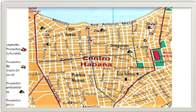
Mapa 2. Proyectos socioculturales

Además de los proyectos que trabajan directamente la temática ambiental se identificaron diez proyectos socio-comunitarios con gran potencial para transverzalizar la dimensión ambiental, los cuales se muestran en el siguiente mapa: